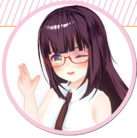
なでしこ しおん 撫子 Vtuber 星音

かなっくホール レジデントアーティスト。調布市せんがわ劇場 演劇ディレクター。日本演出者協会 副事務局長。2010年に第0楽章を設立、代表と演出を担う。11年に日本演出者協会「若手演出家コンクール2011」優秀賞。12年には、京都舞台芸術協会プロデュース2012「演出家コンペティション」最優秀演出家。近年は、他団体作品やプロデュース公演でも演出、俳優、演出補、演出助手、ドラマツルクなど様々なカタチで参加。ほか、地域プロジェクトや海外プロジェクトの企画運営、教育機関や福祉施設でのワークショップなど多岐にわたり活動。