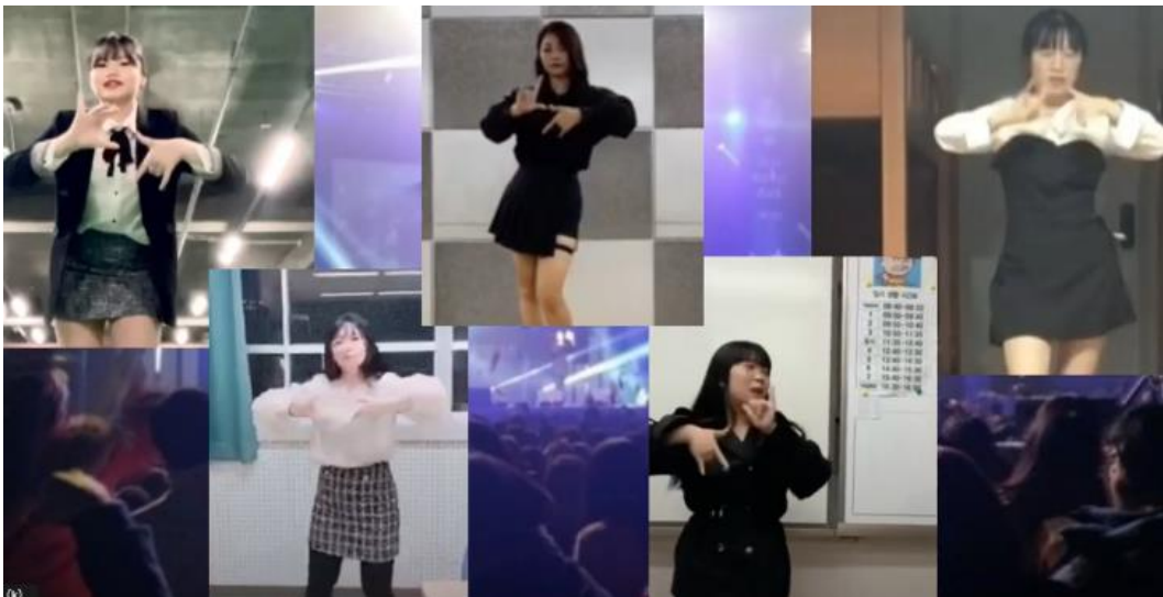
2020년도 우승팀 TWINKLE