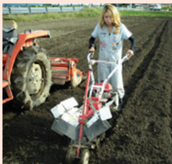
学会了操作各种农业机械。

父母看我在家闲着，就让我去帮他们干农活。小时候，父母总让我干分种子等琐碎麻烦的活儿，所以我一直觉得农活是很无聊的。但有一天，父母第一次让我开了拖拉机，还使用了以前没见过的农业机械。让我第一次感到“农活还挺有趣的呢”，以前对农业的那种“土气、单调、无聊”的印象被一扫而光。在干农活的过程中，我不仅体会到使用农业机械的乐趣，还尝到了收获自己劳动果实的喜悦。就这样，我渐渐迷上了农业。现在，我已经会种很多东西，有水稻、大葱、洋葱、玉米、茄子、西红柿、毛豆、土豆、南瓜、青菜、芦笋、卷心菜、白菜等等。