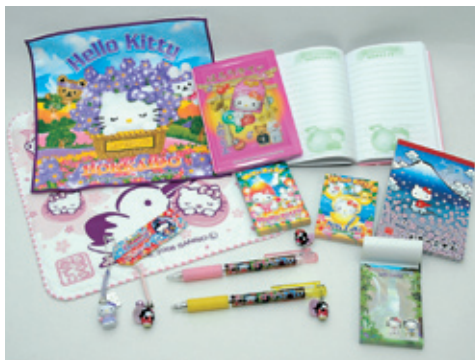
© 1976, 2009 SANRIO CO., LTD, APPROVAL NO. S503076

本地小饰品中特别有人气的是“着丘丘比”及“本地凯蒂猫”等。这是将日本有名的丘丘比及凯蒂猫披上当地特产、名胜古迹以及名人等衣装的商品。其中包括印有这类卡通人物的文具、手帕等。1998年“薰衣草凯蒂猫”问世以来，至今据说已有1,000多种本地凯蒂猫出售。此外，迪斯尼卡通人物的美妮、史迪奇也有各种本地版本。除了这些全国知名的卡通人物外，以当地物产为主题的区域特色商品也广受欢迎。