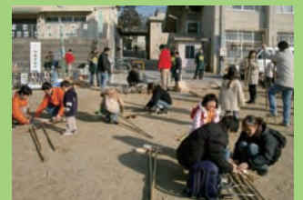
2007 年 1 月，京都府向日市工商业会举办的第 5 届日本全国竹马大会。会上还开办了家庭竹马教室。