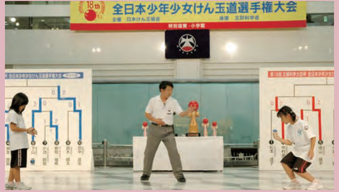
每年夏天进行的全日本少年托球冠军赛。从全国 10 个地区选拔出小学生男女各一名，以淘汰赛方式进行比赛。

“日本けん玉協会（日本托球协会）”主页 http://www.kendamakyokai.com/