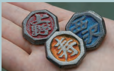
(上) 刻有人名及地名的贝陀螺。(右) 在东京老城区举办的陀螺交流会。孩子们向大人请教玩贝陀螺的方法。(图片下端为正在“场地”里转着的陀螺)

战后，从昭和20年代到30年代后期，陀螺成为孩子们的主要游戏之一。制作陀螺的工厂也很多，而现在只有埼玉县的川口市还留下一处。尽管如此，现在仍有许多贝陀螺的爱好者，差不多每周都会在各地的公园等处举办各种大小不同的竞技活动。