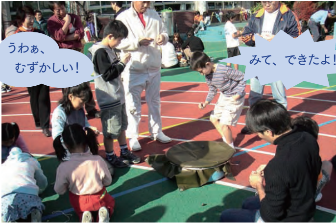
“哇，好难啊！”“哈哈，我也会做了！”