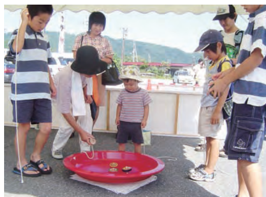
2006年，由“全日本独楽回しの会”(全日本转陀螺会)主办的第7届全日本转陀螺大会。