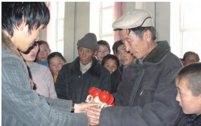
モンゴルの人たちにけん玉を贈呈。