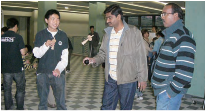
大学祭で開いたけん玉コーナー。全く初めて見る人もいれば、似たような遊びをしたことがある人もいます。

DAMA けんに入るまで、子どもたちと遊ぶのは苦手でした。でも、けん玉をもっていると、すんなり子どもたちの中に入っていけるんです。子どもたちと遊ぶのを楽しんでいる新しい自分を発見しました。