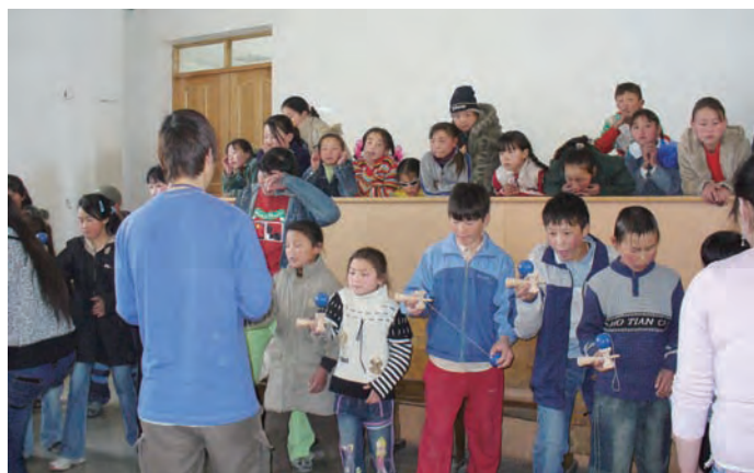
モンゴルの子どもたちにけん玉を教える。