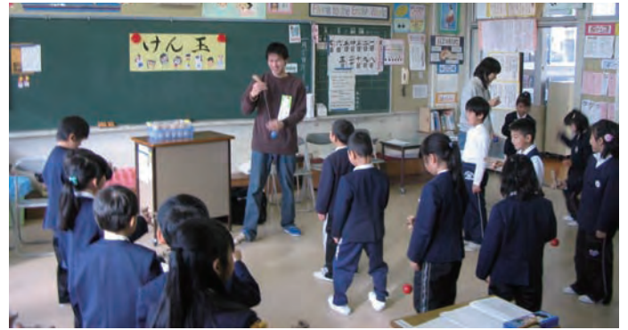
地元の小学校の教室で。授業の一環として依頼されることもある。

も性別も関係ないし、運動神経がいい、悪いも関係ない。足が速い人が上手いわけでもない。誰でもできるんです。人によって上手い下手はあるけれど、誰にも平等だと思います。やればやっただけ上手になるんです。練習していると、できなかったことがある日突然できるようになるんです。そのときは、単純に嬉しいです。できたというのがはっきりわかるので、達成感を得やすいんです。それもけん玉の魅力です。