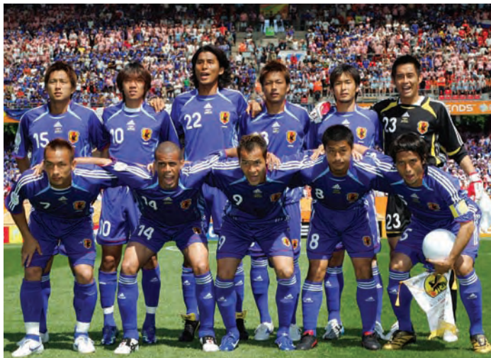
参加2006FIFA世界杯足球赛的日本代表队

2002年的世界杯首次由日本和韩国两个亚洲国家共同承办。中国队也首次打入了世界杯决赛圈。由于看到了世界上顶尖水平的比赛，又近距离地看到了各国代表选手，以往对足球不太感兴趣的人们也卷入了世界杯赛的热潮当中。同时，以世界杯为契机，在主办地建设了大型体育场，还诞生了新的足球队等等，这届世界杯大大提升了日本足球的人气。