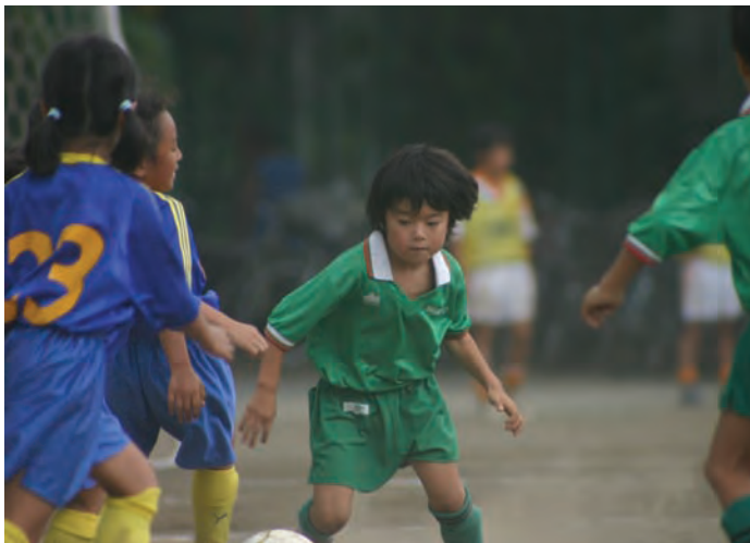
周末，常常看到孩子们在校内或公园里踢足球的情景

为所在地区的球队，由此，将声援球队的人们称为“声援者”，而不是“球迷”。J联盟还开设足球培训班为当地的孩子们进行培训等，非常重视与当地人的交流。通过这些做法使得足球竞技人口及观战人口数量不断增多。