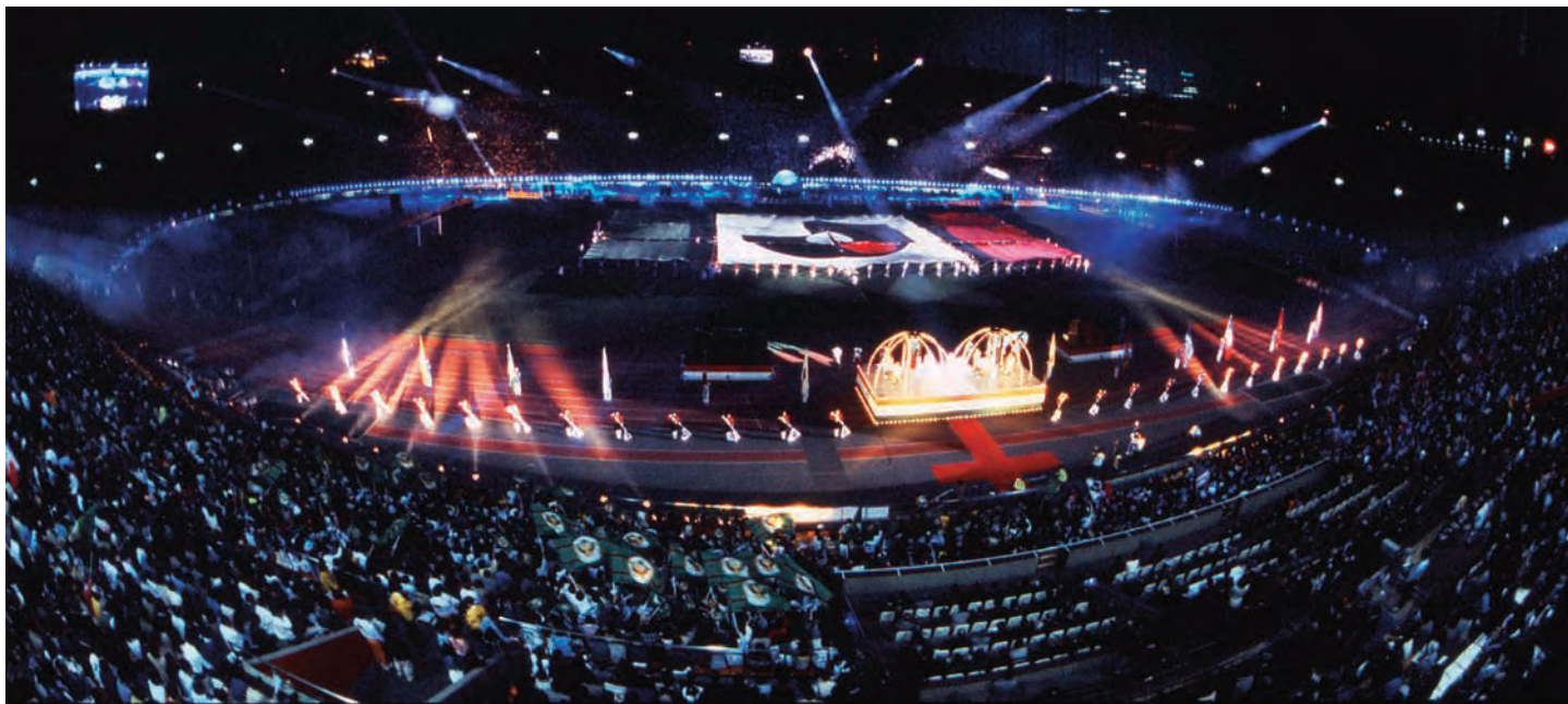
1993年5月的J联盟赛开幕式。在国立竞技场,5万观众欣赏了精彩的表演。

伴随足球人气的日益上升,人们对日本队的关注程度也在提高,急切地期待着日本代表队能在1994年的世界杯上闪亮登场。日本队在亚洲