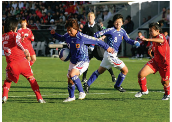
参加2006AFC亚洲杯女足赛的日本女子代表队

日本女子足球的竞技人口大约有25000人。近年来还在稳步增长，但远不及美国的800万人。有很多女孩子虽然在小学的时候踢足球，但升入中学后，由于没有可以归属的球队，只好放弃了足球。为此，JFA整备了可供中学生练习的足球场，把推广女子足球，培养选手作为最大的目标。JFA足球学校（参阅人物采访）就是为此而创办的。