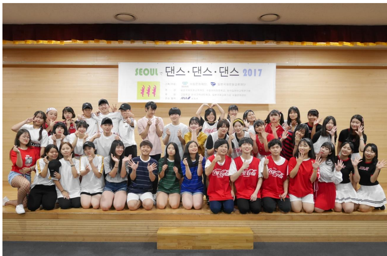
<2017年8月10日発表会で撮った集合写真>