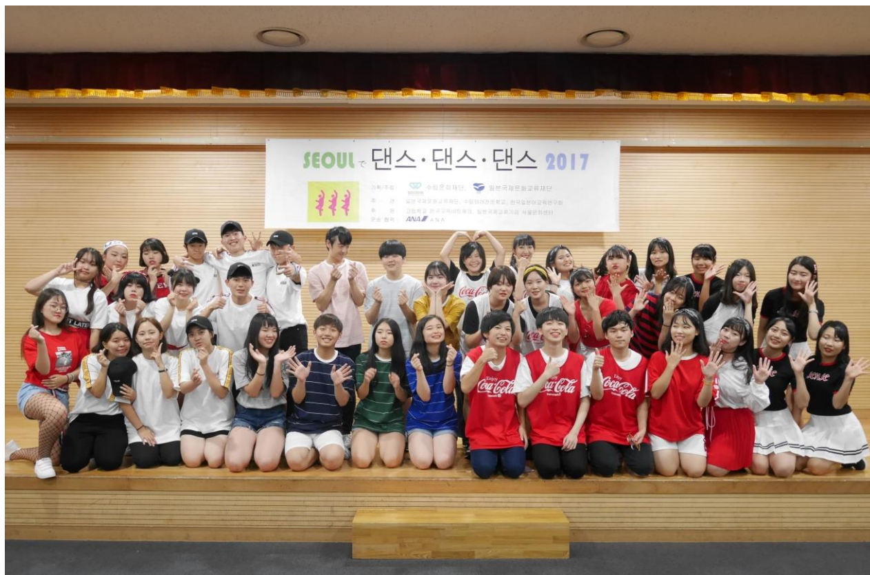
<2017年8月10日発表会で撮った集合写真>